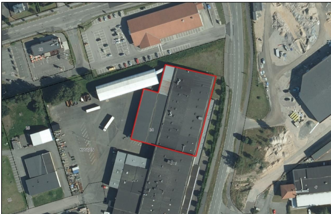
Lokalisering av befintlig verksamhet (markerad i rött)